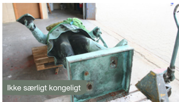
Ikke særligt kongeligt